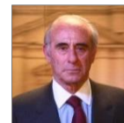
Sergio Bitar CH. Presidente, Consejo Chileno de Prospectiva y Estrategia