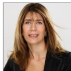
Ximena Rincón G. Ministra del Trabajo