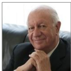
Ricardo Lagos E. Ex Presidente de la República