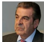
Eduardo Frei R. Ex Presidente de la República