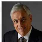
Sebastián Piñera E. Ex Presidente de la República