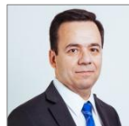
Luis Céspedes C. Ministro de Economía